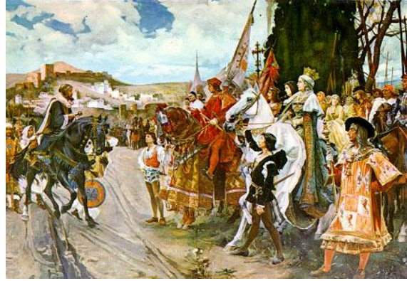
Şehrin anahtarlarının teslim edildiği tepe. Bu tepeye 'Arabın ah ettiği tepe' denir.

Sonuçta 2 Ocak 1492 tarihinde Gırnata'daki son Müslümanlar da teslim olmak zorunda kaldılar ve böylece Müslümanların İberya Yarımadası'nda 800 yıla yakın süren siyasi varlıkları sona ermiş oldu. 16 2 Ocak-İspanya'da Kral Ferdinand ve İsabella uzun bir kuşatma'dan sonra Emevi sultanı Abdullah'ı yenerek Granada'yı ele geçirdi.